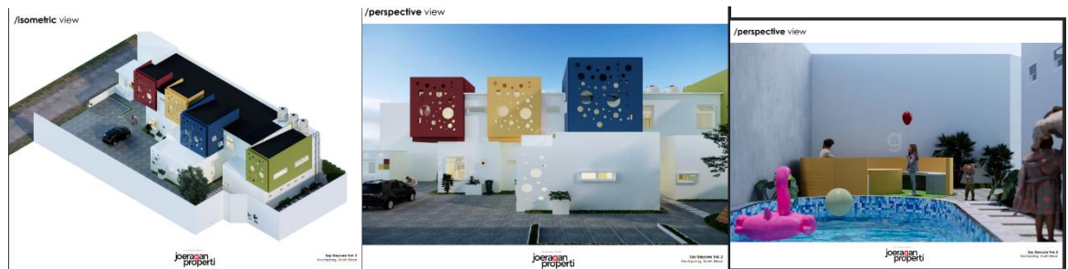
Gambar 2. Site Plan Bangunan TK PAUD SAY SCHOOL yang Sedang Dibangun